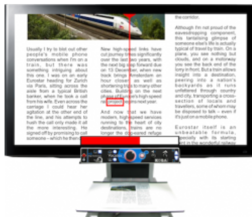
photo du Téléagrandisseur Vocatex Plus

Vocatex 3 est un téléagrandisseur haute définition de qualité supérieure avec lequel vous pouvez visualiser des textes agrandis tout en les faisant lire par l'intermédiaire d'une synthèse vocale, réduisant ainsi la fatigue visuelle et vous permettant de lire plus longtemps. Avec cette nouvelle version, bénéficiez de performances accrues, tant au niveau visuel que vocal. En outre, Vocatex 3 gagne en légèreté et en compacité sur ses déclinaisons 22 et 27 pouces.